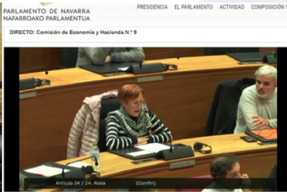
Lectura crítica de Derechos Humanos