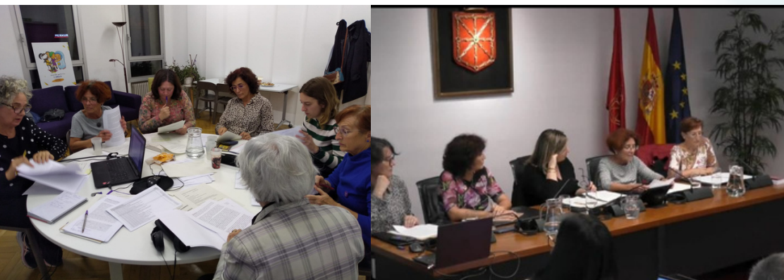
Sesiones de trabajo