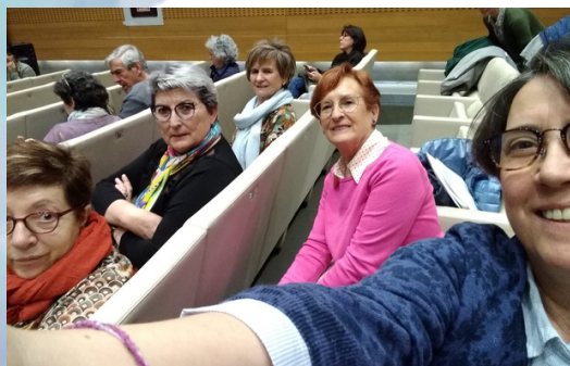
Participación en el Pacto por los Cuidados de Navarra