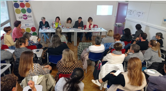
Mesa redonda sobre políticas de igualdad