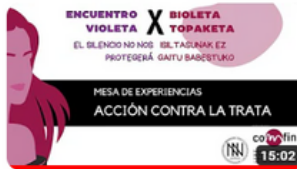
ACCION CONTRA LA TRATA X EV 2023