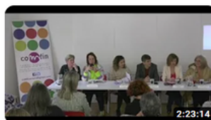
PROPUESTAS EN MESA REDONDA CON REPRESENTANTES DE LOS...