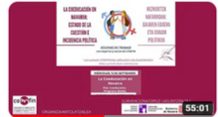
COEDUCACION EN NAVARRA parte 2