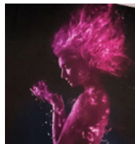
Ave Fénix de Pamplona