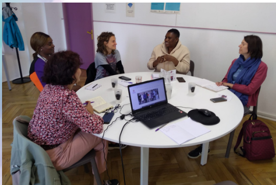
Acción contra la Trata en COMFIN