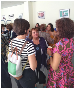
X Encuentro Violeta