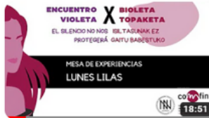
LUNES LILAS X EV