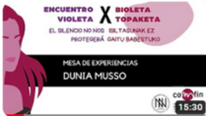
DUNIA MUSSO X EV 2023