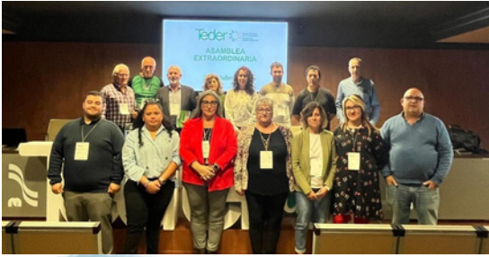
COMFIN en la nueva Junta Directiva de TEDER