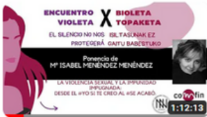
ISABEL MENÉNDEZ MENÉNDEZ