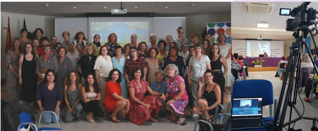
X Encuentro Violeta, presencial y emitido en directo