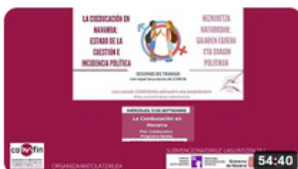
COEDUCACION EN NAVARRA parte1