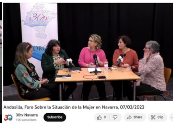
En la televisión de Andosilla