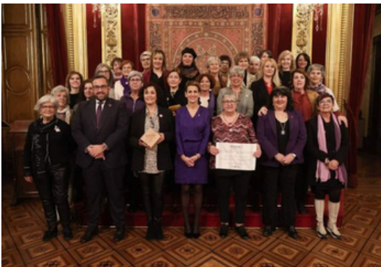
Entrega del Premio Berdinna