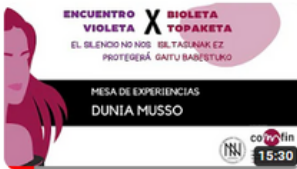
DUNIA MUSSO X EV 2023