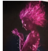
Ave Fénix de Pamplona