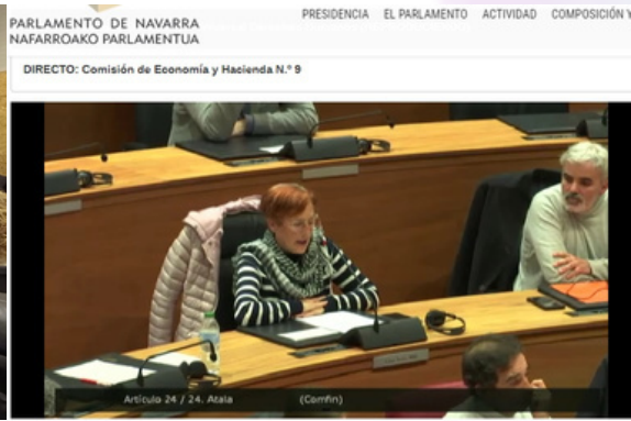
Lectura crítica de Derechos Humanos