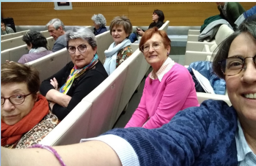
Participación en el Pacto por los Cuidados de Navarra