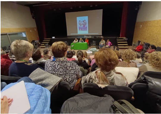
I Encuentro de Mujeres y/o Feministas de la Ribera