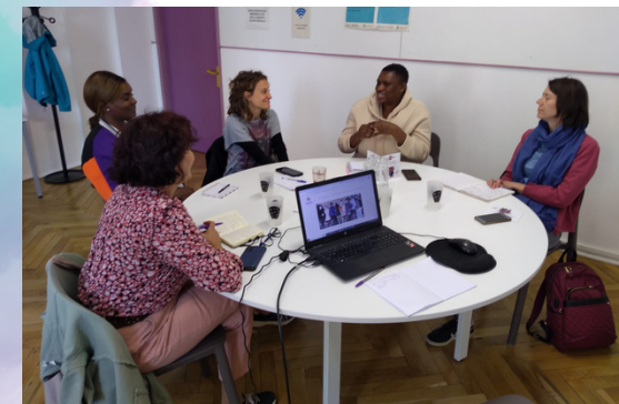
Acción contra la Trata en COMFIN