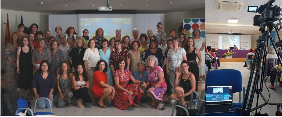
X Encuentro Violeta, presencial y emitido en directo