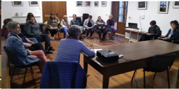
Taller de gestión asociativa con Aranbeltza