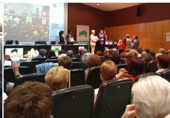
25º Aniversario de AFAMMER