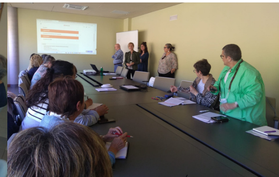
Coordinación para subvenciones del INAI