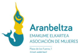
Aranbeltza de Arróniz