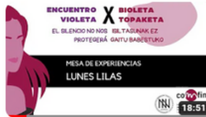
LUNES LILAS X EV