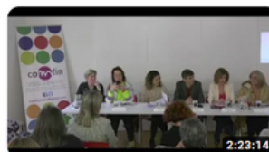
PROPUESTAS EN MESA REDONDA CON REPRESENTANTES DE LOS...