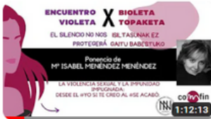
ISABEL MENÉNDEZ MENÉNDEZ