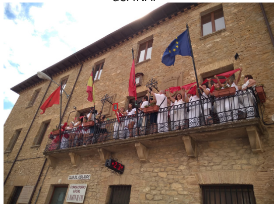
Txupinazo de Garnatxa en Sant Martín de Unx