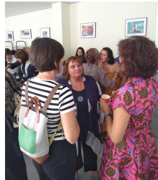
X Encuentro Violeta