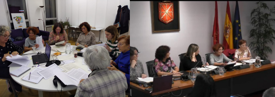
Sesiones de trabajo