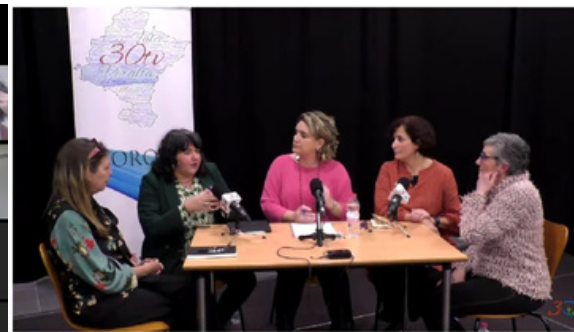
Andosilla, Foro Sobre la Situación de la Mujer en Navarra, 07/03/2023