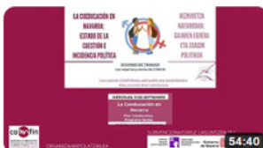
COEDUCACION EN NAVARRA parte1 117 visualizaciones · hace 3 meses