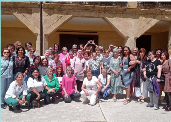
Asamblea de socias en Beire