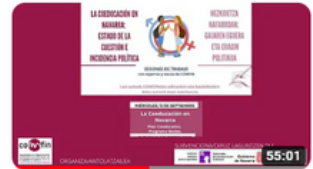
COEDUCACION EN NAVARRA parte 2