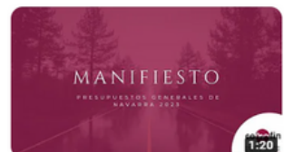
Manifiesto con Perspectiva de Genero de los Presupuestos Generales de...