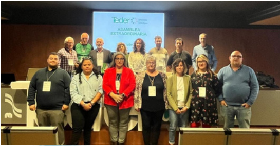
COMFIN en la nueva Junta Directiva de TEDER