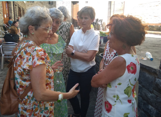
25º Aniversario de Gaztelu