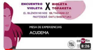
ACUDEMA X EV