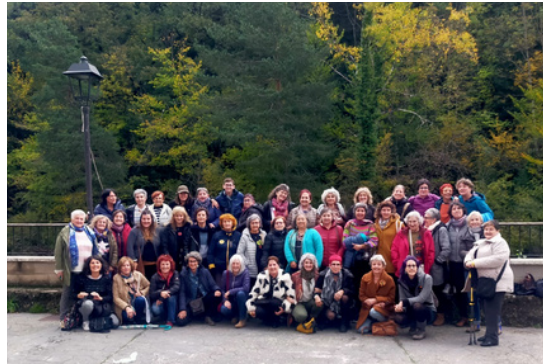
XXII Encuentro de Mujeres del Pirineo