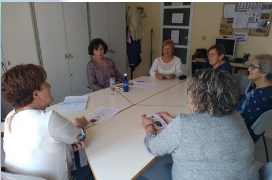
Visitas a asociaciones de mujeres