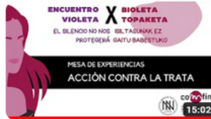
ACCION CONTRA LA TRATA X EV 2023