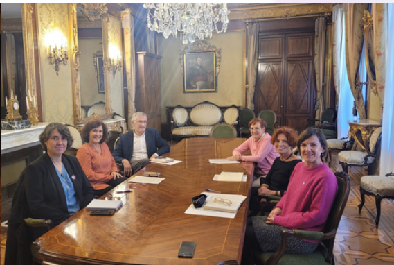
Reunión con el vicepresidente y la directora del INAI